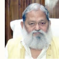
गुनगुनाया, जो उनकी राजनीतिक परिस्थितियों को दर्शाता है। गौरतलब है कि अपने मार्मिक बोल

पाठकपक्ष न्यूज चंडीगढ़, 10 अप्रैल : हरियाणा के पूर्व गृह मंत्री और अंबाला कैट से विधायक अनिल विज इस समय सुखियों में बने हुए हैं। बीजेपी-जेजेपी गठबंधन सरकार के गठन के दौरान उपेक्षा और उपमुख्यमंत्री बनाए जाने से नाराज अनिल विज अब अपनी ही पार्टी के नेताओं पर निशाना साध रहे हैं।