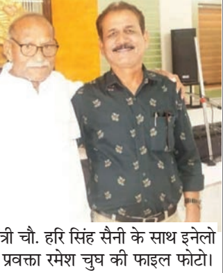
नागोरी गेट के प्रधान थे और सदैव समाजसेवा में लगे रहते थे। उनके निधन से हिसार की राजनीति में एक के नेता थे। सर्वसमाज में उनका मान-सम्मान था। वो आर्य समाज