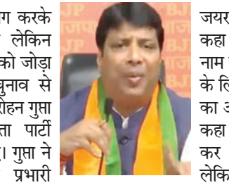
प्रभारी जयराम रमेश पर कटाक्ष करते हुए कहा कि एक संचार प्रभारी हैं जिनके नाम में 'राम' है, उन्होंने हमें चुप रहने के लिए कहा था जब सनातन (धर्म) का अपमान किया जा रहा था। उन्होंने कहा कि देश के नाम का इस्तेमाल कर एक गठबंधन बनाया गया था लेकिन इसमें 'देश विरोधी ताकतों'