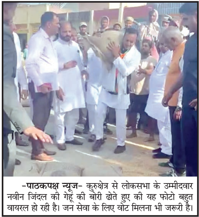
-पाठकपक्ष न्यूज- कुरुक्षेत्र से लोकसभा के उम्मीदवार नवीन जिंदल की गेहूं की बोरी ढोते हुए की यह फोटो बहुत वायरल हो रही है। जन सेवा के लिए वोट मिलना भी जरूरी है।