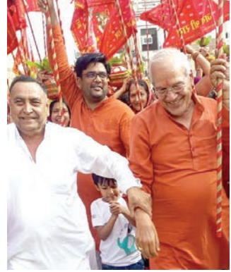
गया। समाप्ति पर आरती के साथ प्रशाद वितरण किया गया।